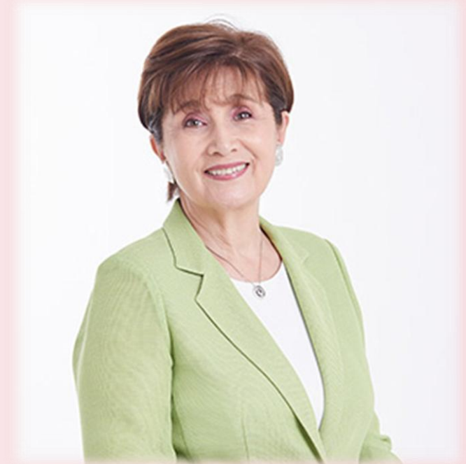
公益財団法人 東京都つながり創生財団

同時に、わたしたち自身も、組織体制やシンクタンク機能を強化し、蓄積したノウハウ等を地域に還元するとともに、現場目線で都の施策検討に参画するパートナーとして貢献してまいります。